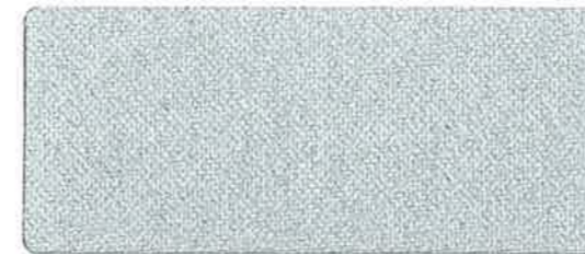
<1043> シルバーコート (裏起毛) 125cm 巾 × 100m 乱