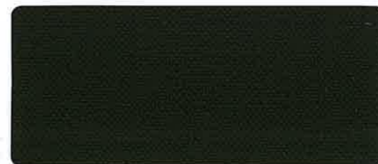
綿帆布 11号 OD-KS 92cm 巾 × 50m 乱 ロール仕上