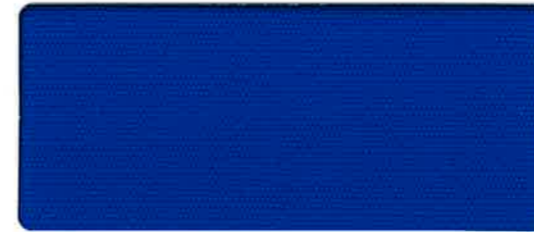
<735> 撥水加工 ブルー 115cm 巾 × 50m 乱