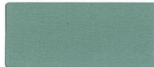
79-A 銀鼠赤馬防水 92cm 巾 × 40m 乱 ロール仕上