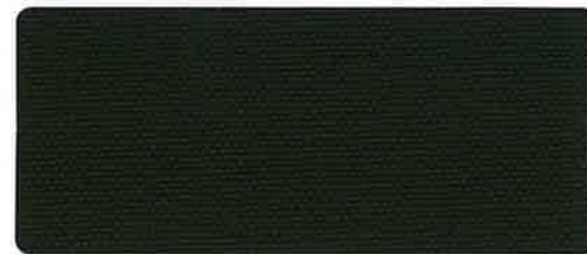
綿帆布 10号 OD-KS 92cm 巾 × 50m 乱 タタミ&ロール仕上