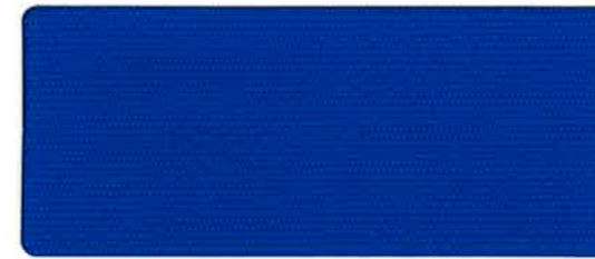
撥水加工+アクリルコート ブルー 114cm 巾 × 50m 乱