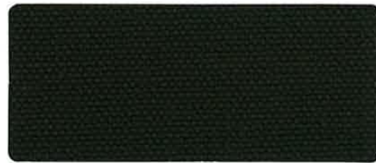
綿帆布 6号 OD-KS 88cm 巾 × 50m 乱 ロール仕上