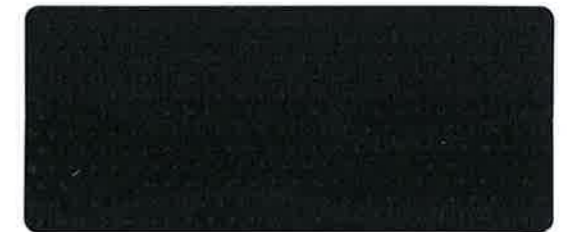
<150D-150> クロ 150cm 巾 × 100m 乱