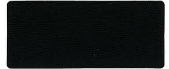
<735> 撥水加工 ブラック 115cm 巾 × 50m 乱