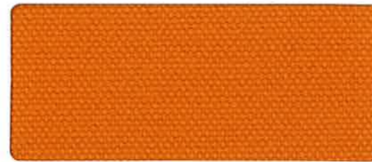
綿帆布 6号 オレンジ 92cm 巾 × 50m 乱 ロール仕上