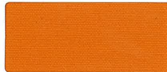
綿帆布 9号 オレンジ 92cm 巾 × 50m 乱 ロール仕上