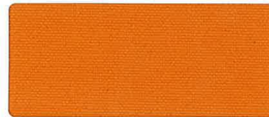
綿帆布 10号 オレンジ 92cm 巾 × 50m 乱 ロール仕上