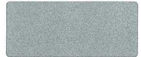
<207> シルバー 112cm 巾 × 27m 乱