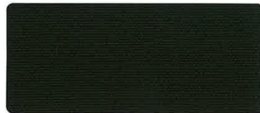
綿帆布 9号 OD-KS 92cm 巾 × 50m 乱 タタミ&ロール仕上